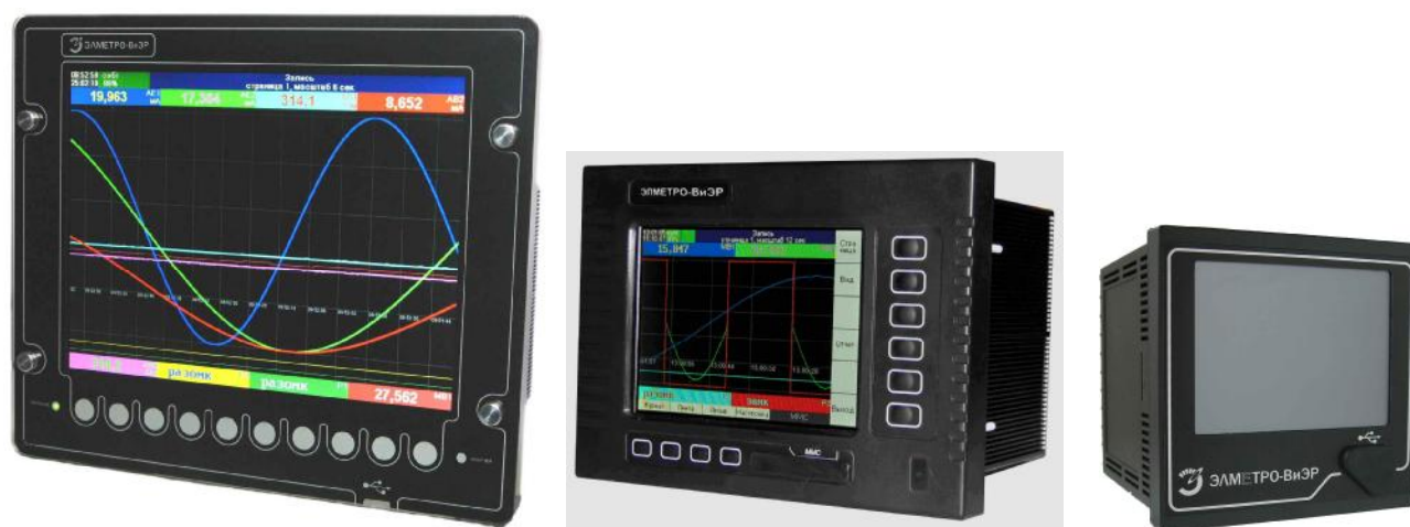
Рисунок 1 – Фотографии общего вида регистраторов

Фотографии общего вида регистраторов представлены на рисунке 1.